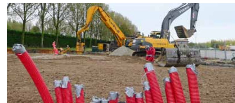
• BSP Moerdijk in aanbouw

Vlak voor de kerst wordt BSP Moerdijk geopend. Deze ligt bij knooppunt Klaverpolder, naast wegrestaurant Kanters. Hier kunnen de volgende brandstoffen getankt worden: AdBlue, diesel, benzines en GTL.