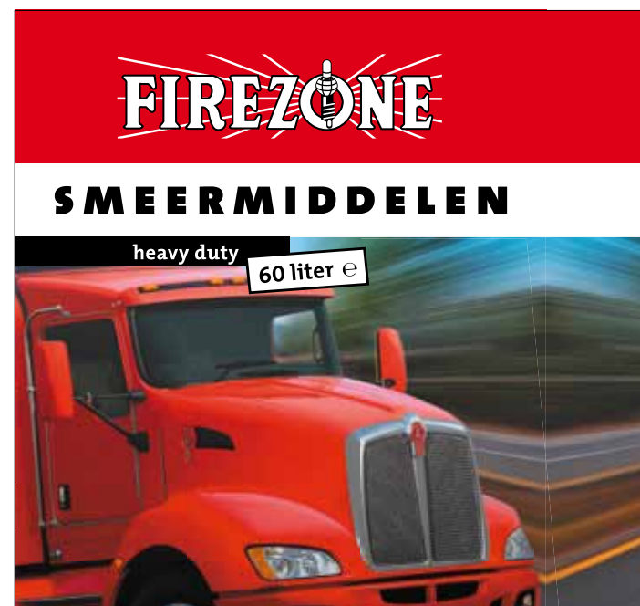
• René Auwema