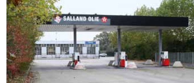
♦ BSP Deurningen