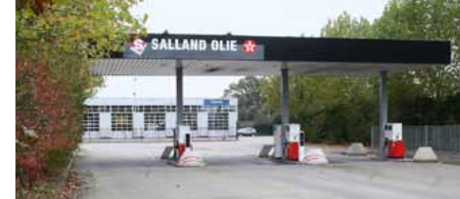
♦ BSP Deurningen