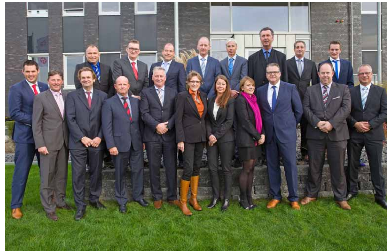
• Verkoopteam Salland Olie

De nieuwe manager verkoop benadrukt de significantie van een gezonde werksfeer. “De reden dat ik 19 jaar werkzaam was voor dezelfde werkgever, komt grotendeels voort uit het feit dat ik me er vanaf het begin als een vis in het water voelde. Naarmate dit gevoel