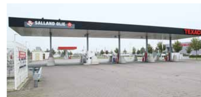
♦ BSP Zwolle

Onze onderhoudsdienst houdt namelijk alles perfect bij. En als er eens iets kapotgaat, dan lossen we dat snel op. Bij ons moeten klanten altijd kunnen tanken. Immers, stilstand betekent tijdverlies. En tijd is geld. Zeker in de transportwereld."