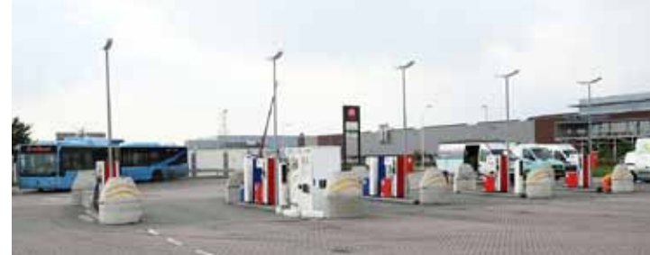
♦ BSP Apeldoorn

Paul: "Dankzij invoering van de unieke Tag betaalmethode en de 'BSP finder'-app wordt het straks nóg makkelijker voor de chauffeurs om bij één van onze BSP's te tanken. Terwijl de app fungeert als routebegeleider naar de dichtstbijzijnde BSP binnen het Benelux-netwerk, en op die manier brandstof, tijd én kilometers bespaart, versnelt en vergemakkelijkt de Tag de betaalwijze. Bovendien kunnen chauffeurs rekenen op een schone tankomgeving en goed functionerende installaties.