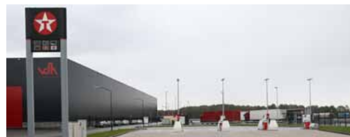
♦ BSP Hapert