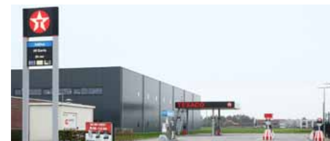
♦ BSP Heerenveen