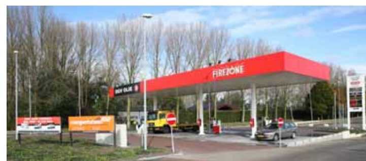
♦ BSP Moerdijk