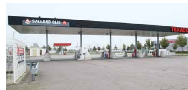
♦ BSP Zwolle

Onze onderhoudsdienst houdt namelijk alles perfect bij. En als er eens iets kapotgaat, dan lossen we dat snel op. Bij ons moeten klanten altijd kunnen tanken. Immers, stilstand betekent tijdverlies. En tijd is geld. Zeker in de transportwereld."