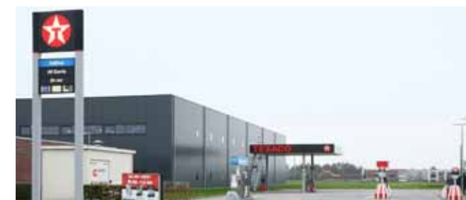
♦ BSP Heerenveen